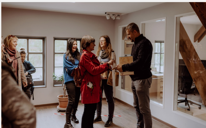
Wizyta w Geoparku Łuk Mużakowa wpisanego na listę UNESCO

W programie kolejnego dnia znalazła się wizyta w Geoparku Łuk Mużakowa, który jest wpisany na listę światowego dziedzictwa Unesco. Park na granicy polsko-niemieckiej chroni widoczną z kosmosu morenę czołową, która powstała w czasie