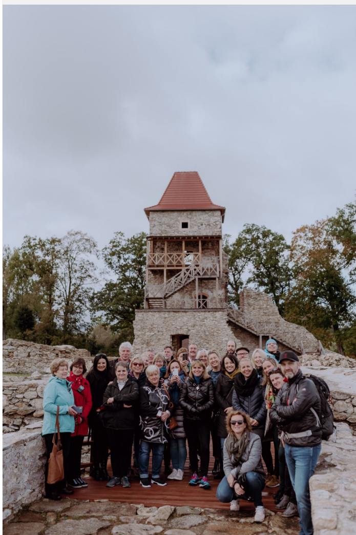
Fot. Maria Peda. W tle odrestaurowane ruiny Zamku w Starej Kamienicy

Ostatni dzień wyjazdu studyjnego zaplanowany został w Euroregionie Pro Europa Viadrina. Podczas wizyty we Frankfurcie nad Odrą poznaliśmy specyfikę współpracy pomiędzy Brandenburgią a województwem lubuskim. Współpraca pomiędzy uniwersytetami we Frankfurcie i Słubicach stała się znakiem firmowym regionu i tworzy ramy dla współpracy polsko-niemieckiej. Chodzi tu nie tylko o wspólne studia, wymianę pracowników i studentów, ale także o wspólne projekty na rzecz rozwoju regionu, takie jak ochrona przeciwpowodziowa czy wspólne patrole policyjne.