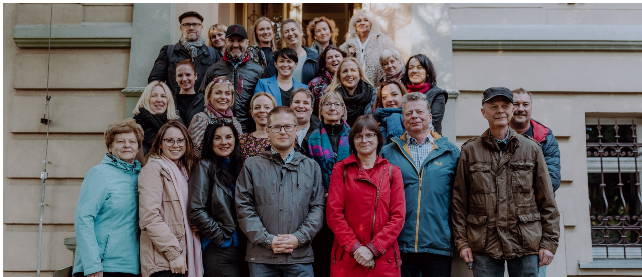
Spotkanie z naszymi kolegami i koleżankami w Euroregionie Sprewa-Nysa-Bóbr w Gubinie