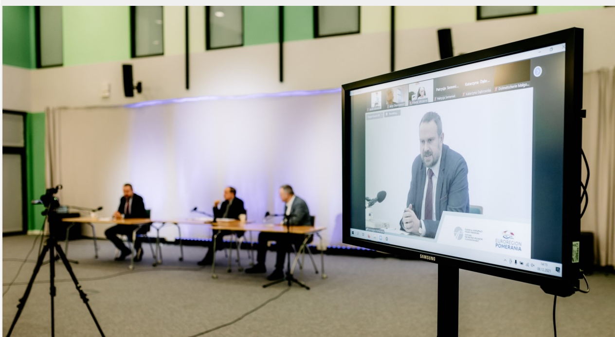
Debata odbyła się w formule on-line