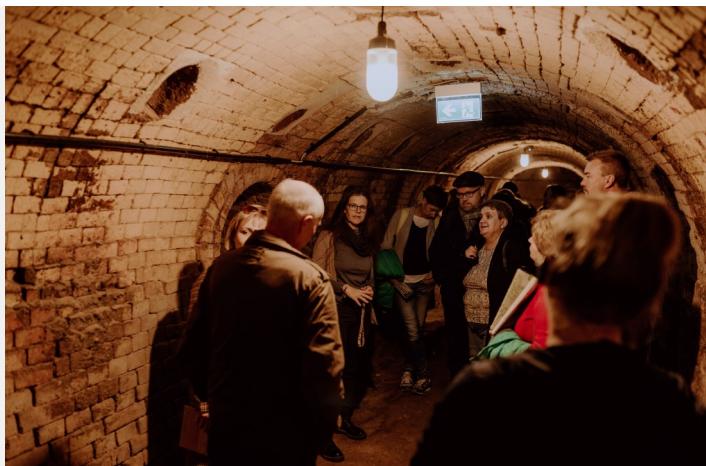
Zwiedzanie zabytkowej cegielni w Klein Kölzig na terenie Geoparku

Atmosferę polsko-niemieckiego pogranicza można było poczuć w bliźniaczym mieście Gubin-Guben, gdzie zostaliśmy zaproszeni przez zarządy obu stowarzyszeń Euroregionu Sprewa-Nysa-Bóbr. Tu znaleźliśmy czas na wymianę doświadczeń z realizacji projektów w ramach Funduszu Małych Projektów, rozmowy o przyszłości naszego regionu przygranicznego oraz o nowych możliwościach, jakie daje nowa perspektywa finansowa 2021-2027.